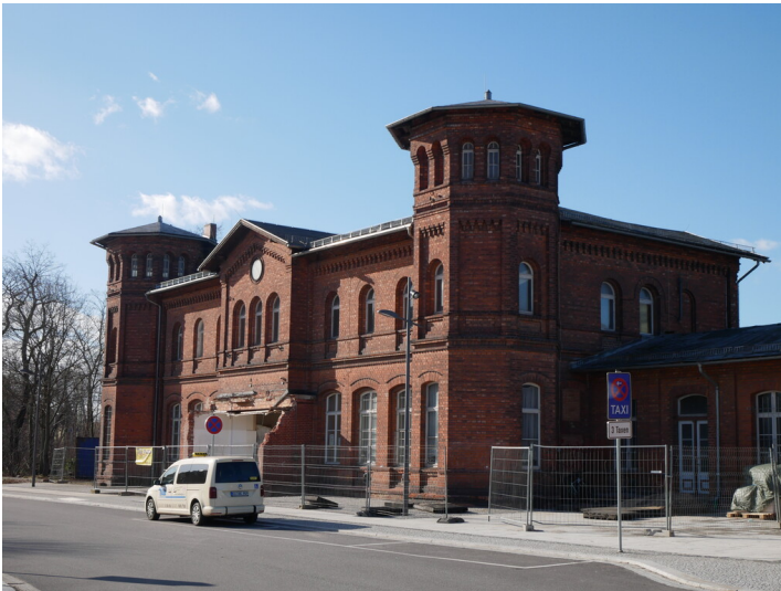
Bahnhof Finsterwalde