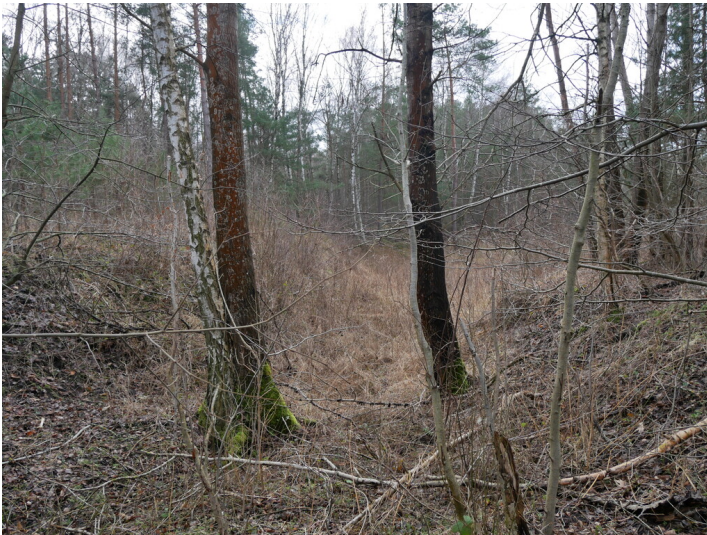
Bahn Hansa Nord-/Ostfeld-Brikettfabrik Hansa/Südfeld