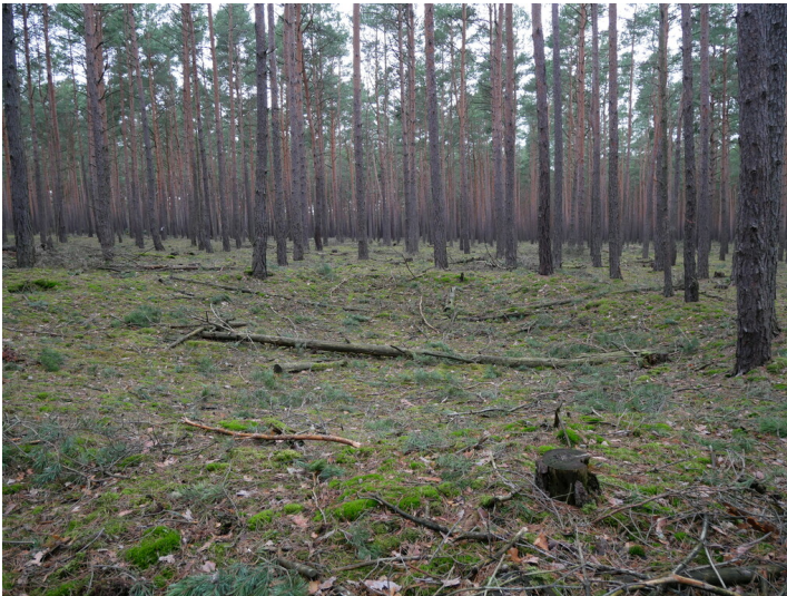
Carolinenglück bei Frankenhain