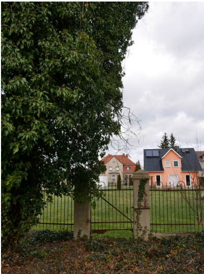
Pfarrgarten der Kirche St. Michael