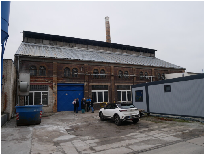
Fabrikgebäude der Johannahütte