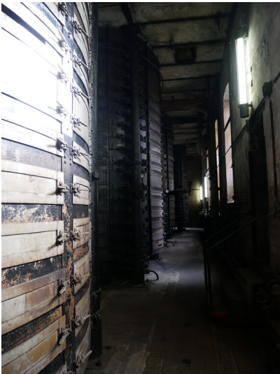
Tellertrockner 2-5