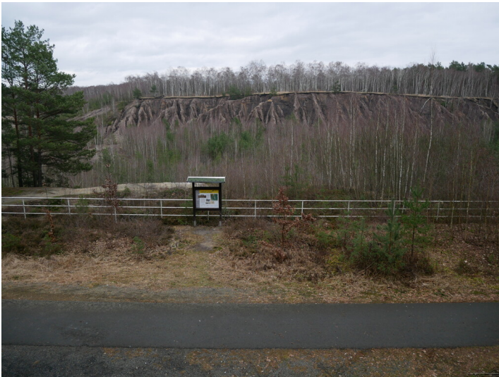
Restloch 124