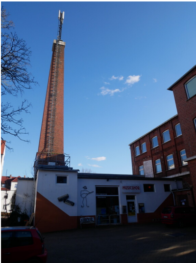
Tuchfabrik F. F. Koswig

Schlagwörter: Tuchfabrik Fachsicht(en): Denkmalpflege Gemeinde(n): Finsterwalde Kreis(e): Elbe-Elster Bundesland: Brandenburg