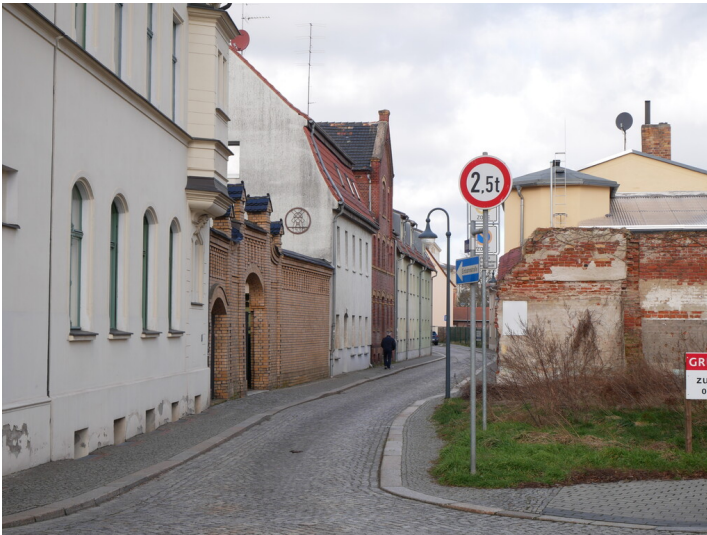
Tuchfabrik F.F. Koswig

Schlagwörter: Tuchfabrik Fachsicht(en): Denkmalpflege Gemeinde(n): Finsterwalde Kreis(e): Elbe-Elster Bundesland: Brandenburg