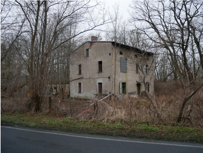
Gebäude der Beutesitzer Kohlenwerke