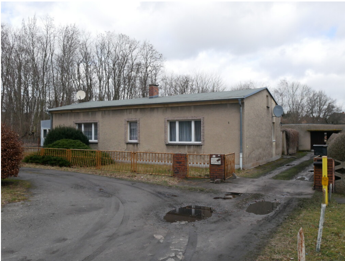
Kontorgebäude der Hedwigshütte