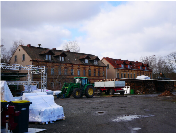
Arbeiterhäuser Grube und Brikettfabrik Hansa