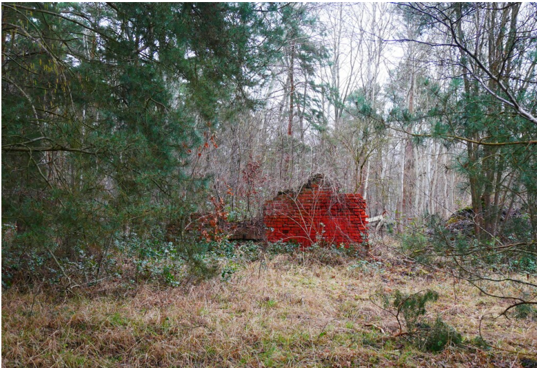
Steigerhaus der Grube Pauline