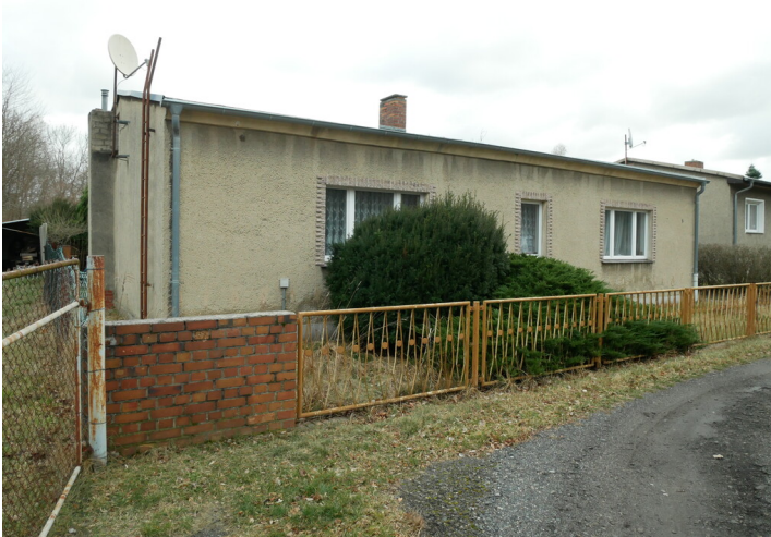
Glashütte Fettke & Ziegler