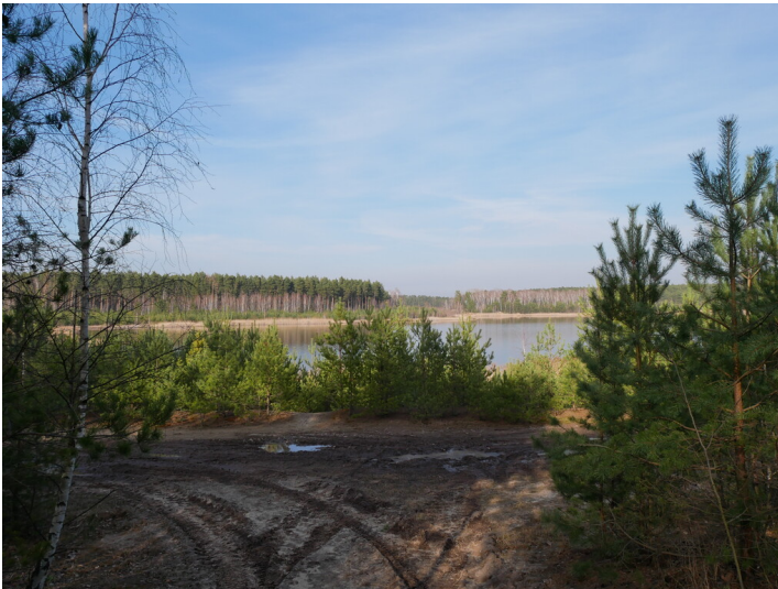
Restloch 126