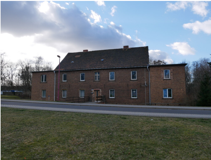
Wohngebäude westlich des Glashüttenareals Robert Hirsch