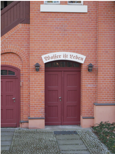
Wasserwerk Finsterwalde