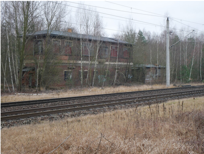
Stellwerk Bahnhof Neupetershain