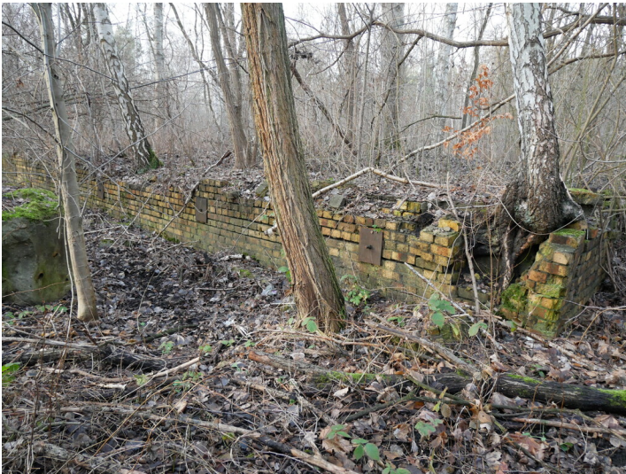
Fundament evtl. Maschinenhaus o. ä.