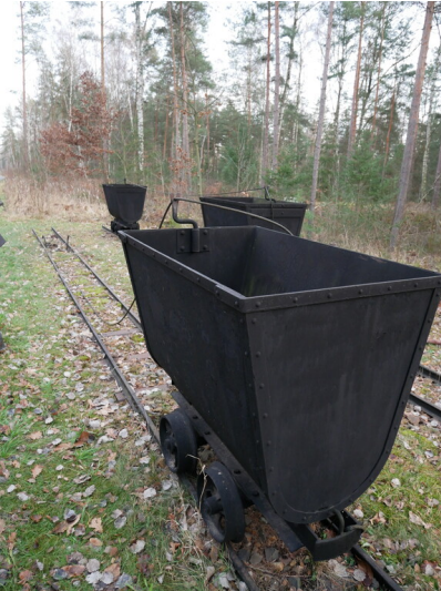
elektrische Seilspurbahn