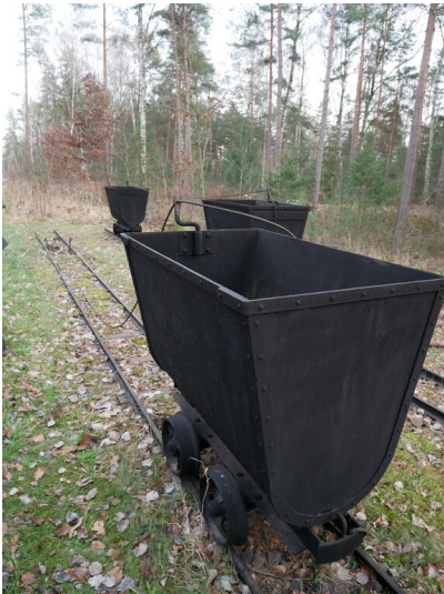
elektrische Seilspurbahn