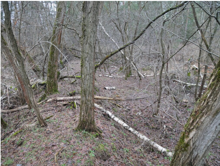
Absetzbecken Grubenwasser Tröbitz-Ostfeld