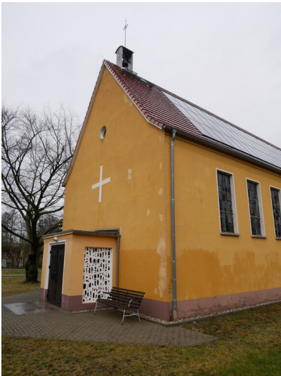
Katholische Kirche St. Bonifatius und St. Elisabeth