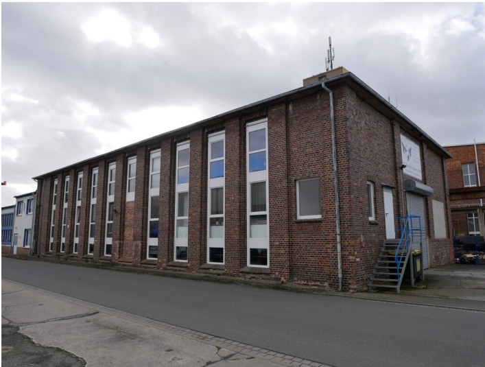
Magazin der Brikettfabrik Hansa