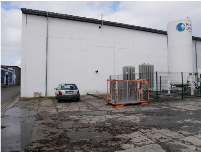
Halle 2a