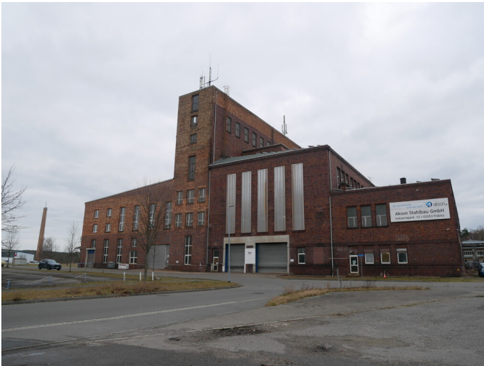
Kraftwerk Tröbitz