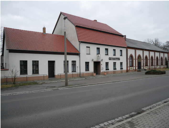
Gasthaus Schönborn