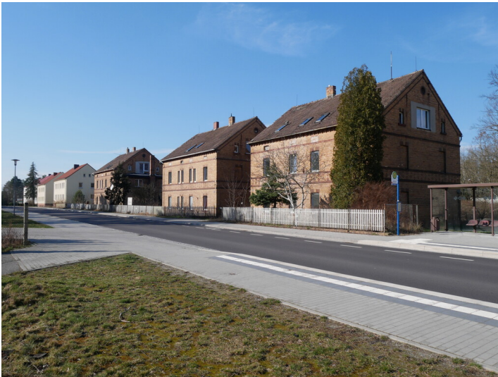
Wohnhäuser der Johannahütte