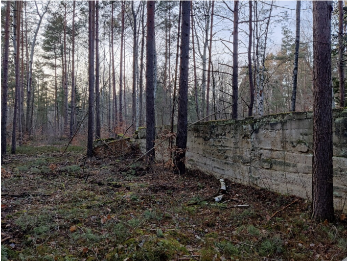
Fragmente aufstrebenden Mauerwerkes, verm. Wirtschaftsbahn Grube Julius