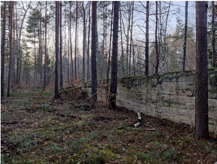
Fragmente aufstrebenden Mauerwerkes, verm. Wirtschaftsbahn Grube Julius