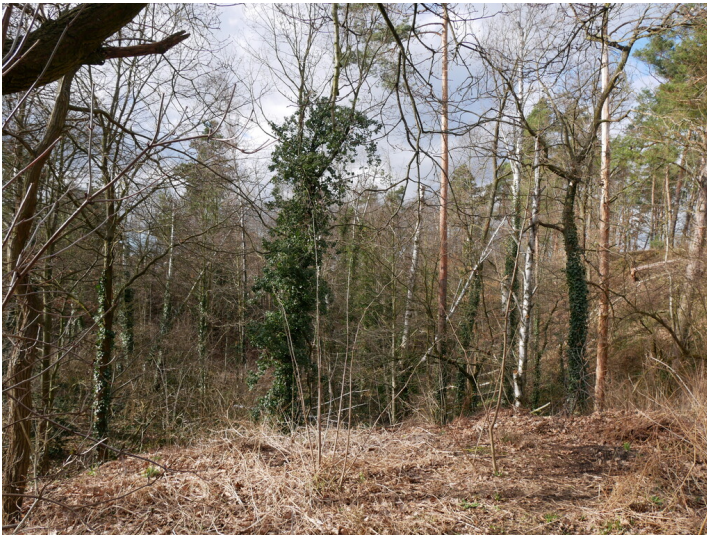
Ziegelei in Bad Liebenwerda