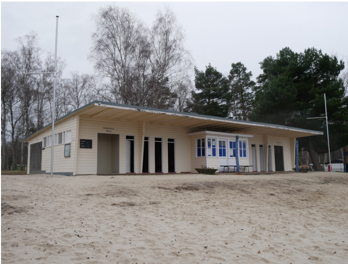
Waldbad Bad Erna