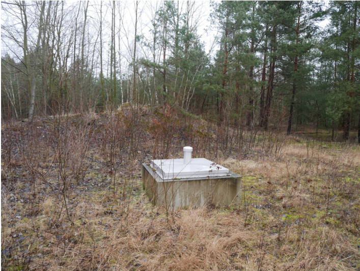
Steinkohlenschacht Doberlug-Kirchhain