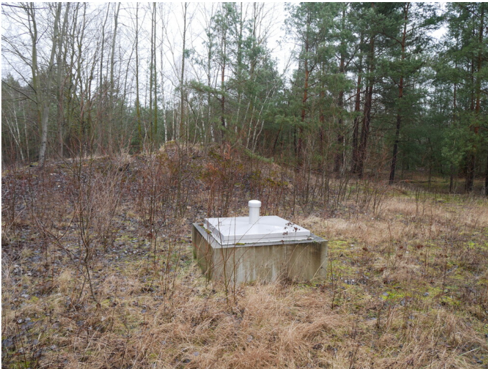
Steinkohlenschacht Doberlug-Kirchhain