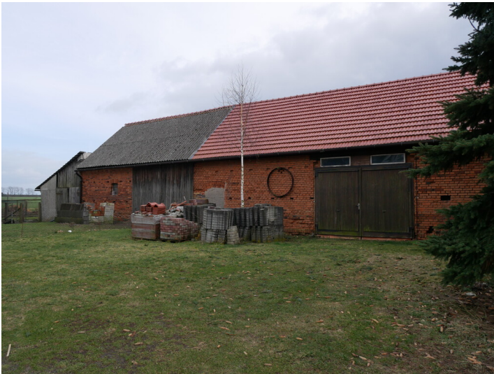
Ziegelei bei Prießen