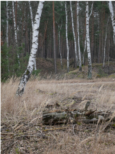
Ziegelei bei Tröbitz