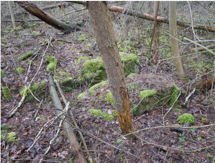
Brikettfabrik Emilie