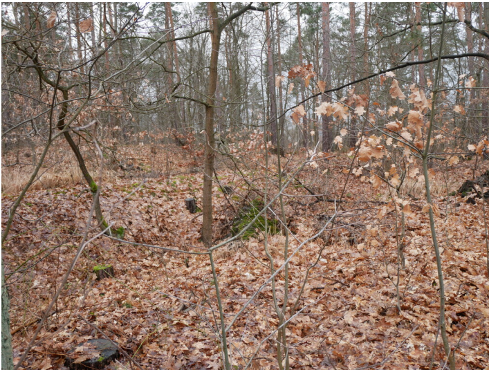
Tagebau Emilie II, Emilie-Westfeld, Caroline