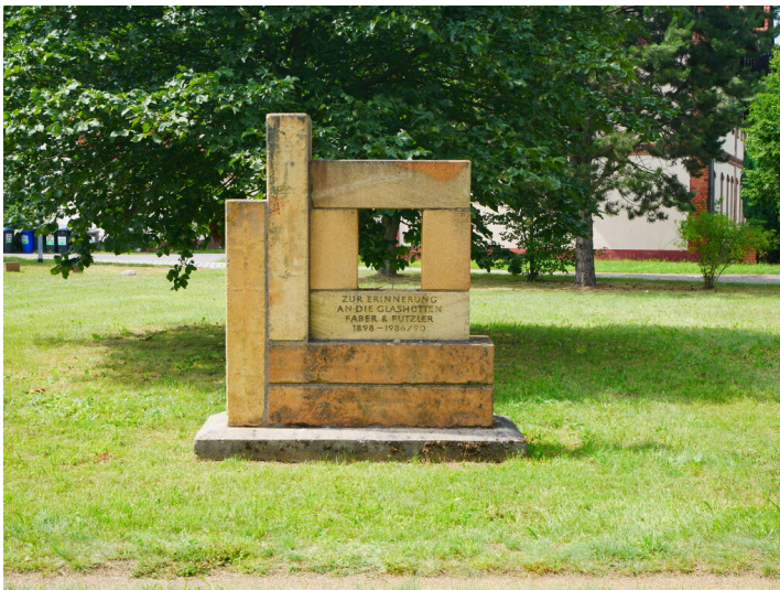
Glashütte Czulius, Thiemann & Co. GmbH