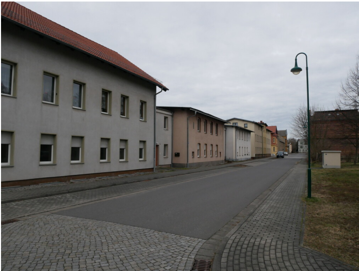
Glashütte Putzler & Ottlinger