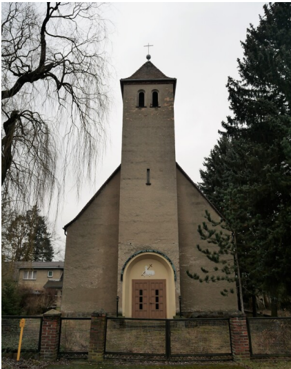
Kirche Hl. Geist und St. Elisabeth