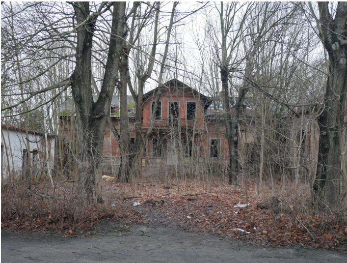
Gasthof Fritz Müller