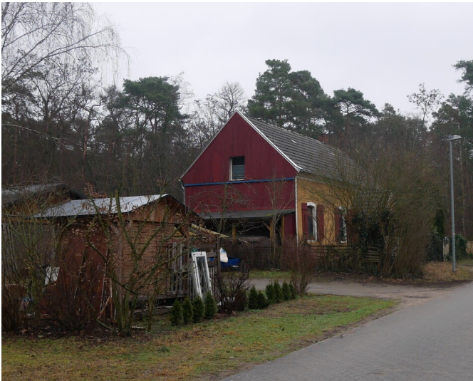
Gebäude der Gruben Michael, Liebenwerda, Therese und Wilhelmine