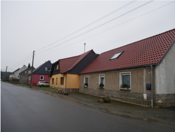
Wohngebäude Domsdorf Erweiterung