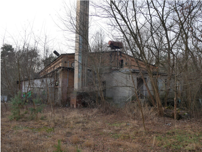
Kesselhaus der Grube Conrad: 1860-1959