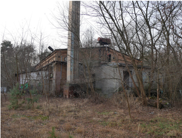
Kesselhaus der Grube Conrad: 1860-1959