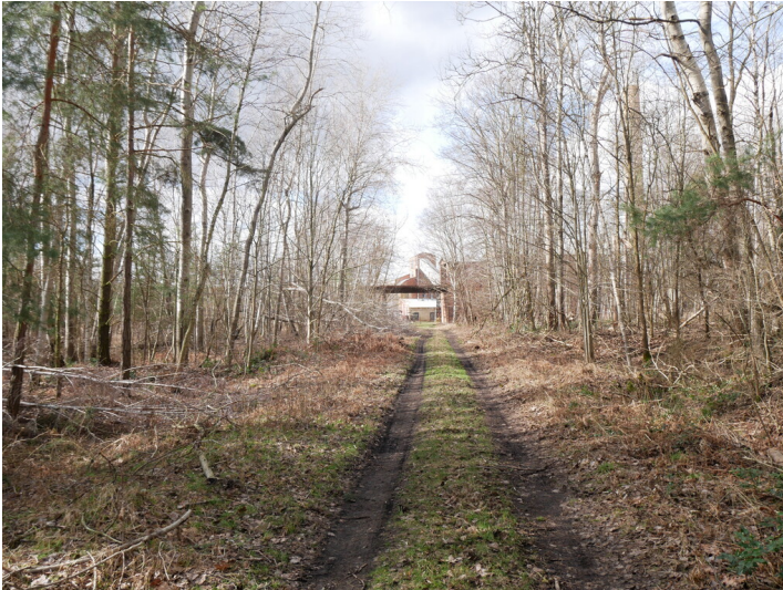
Seilbahn Louise-Alwine