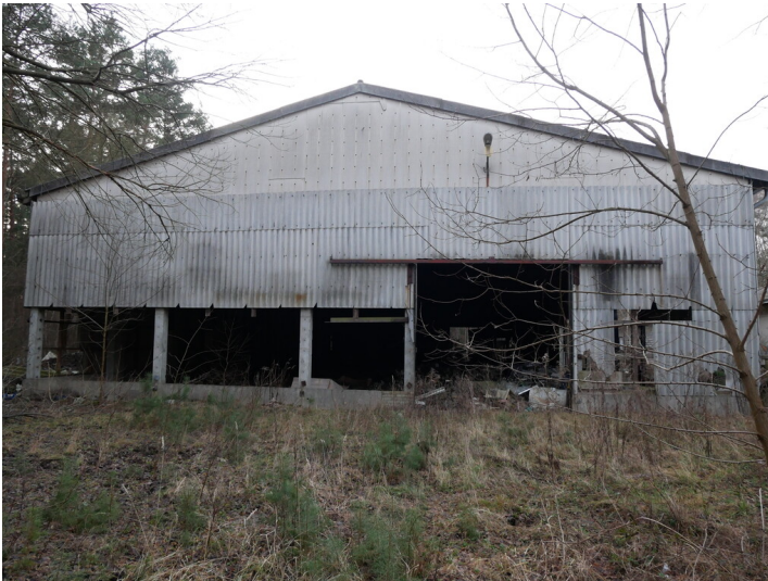
Brikettfabrik der Grube Conrad