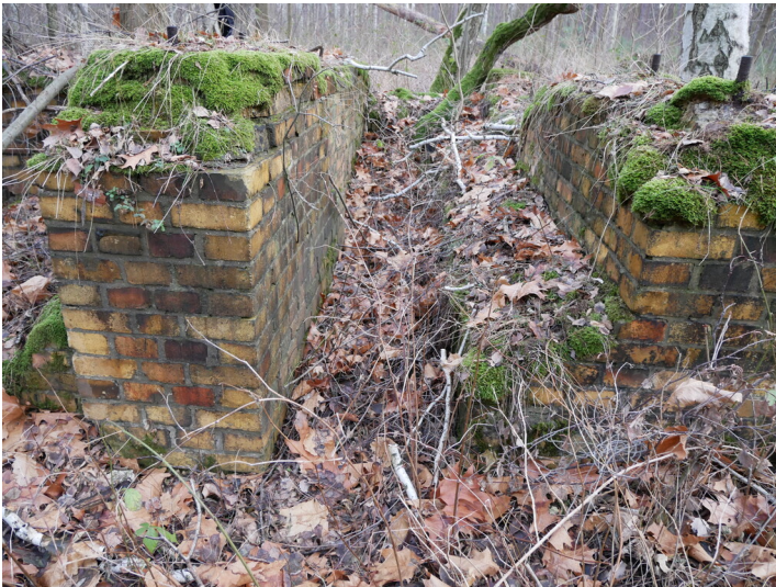
Seilbahn Grube Franz