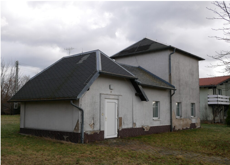
Wasserwerk Domsdorf