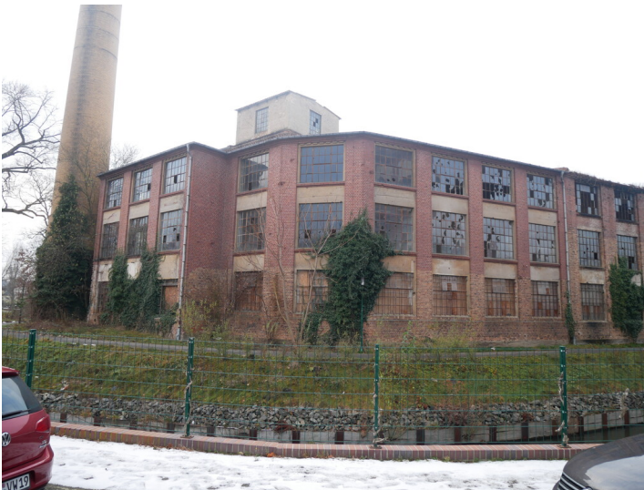
Fabrikgebäude, Verwaltungsgebäude/Kontorgebäude, Maschinenhaus, Kesselhaus

Schlagwörter: Tuchfabrik Fachsicht(en): Denkmalpflege Gemeinde(n): Forst (Lausitz) Kreis(e): Spree-Neiße Bundesland: Brandenburg