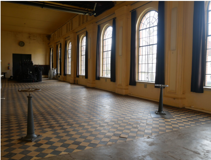
Elektrozentrale der Brikettfabrik Louise