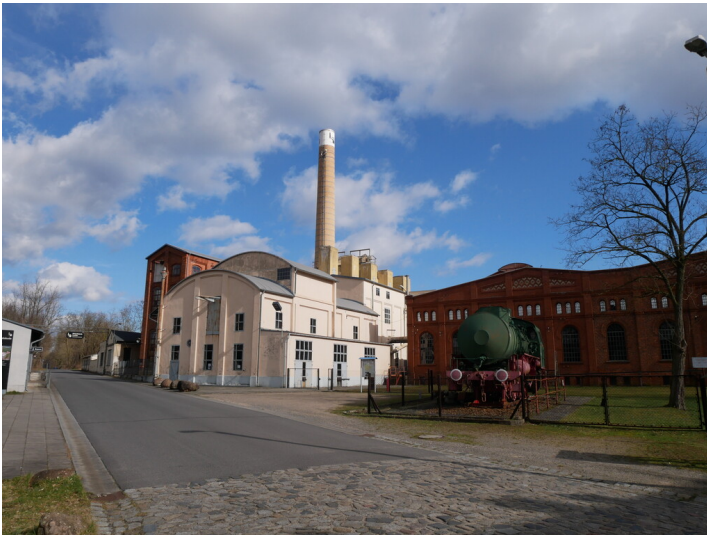
Pressenhaus I Fotograf/Urheber: Kaja Boelcke