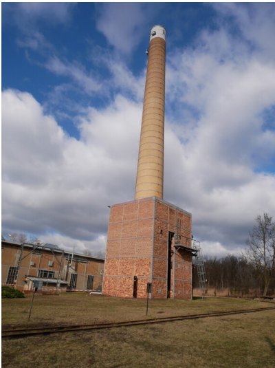
Schornstein der Brikettfabrik Louise